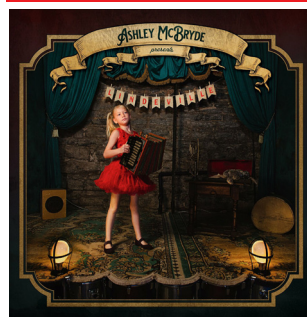
"LINDEVILE" Ashley MCBRYDE

En quelques années Ashley McBryde est passée de l'ombre totale à une incontournable. Elle nous revient avec un album surprenant, majoritairement des duos dont celui avec les Brothers Osborne est un hit en puissance. Ce serait dommage de passer à côté de ce petit dernier.